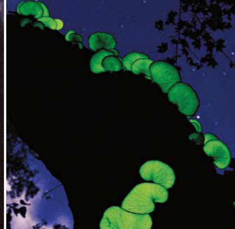
Links und oben: Leuchtender Ölbaumpilz ( Omphalotus sp.). Diese biolumineszenten Pilze leuchten, weil sie Moleküle (Luziferin) enthalten, die bei Oxidation ein nahezu kaltes Licht erzeugen. Folgende Doppelseite von oben links nach unten rechts: Phlogiotis helvelloides , Nidula sp., Pholiota squarrosa , Ramaria sp., Gyromitra esculenta , Humaria hemisphaerica , Helvella macropus , Auricularia delicata , Pseudohydnum gelatinosum , Ascocoryne sarcoides , Stemonitis axifera , Fistulina hepatica .

»Jeder, der eine gewaltige psychedelische Erfahrung in einem Land gemacht hat, in dem dies illegal ist, befindet sich in einem Dilemma – dem Risiko strafrechtlicher Verfolgung für etwas Wertvolles und Tiefgreifendes, ein großartiges persönliches Geschenk, das von der herrschenden Kultur im Allgemeinen nicht verstanden wird. Mögliche Reaktionen wären Wut und Widerstand. Oder aber, wir leisten bessere Arbeit, das Phänomen zu erklären. Wenn die Menschen das verstehen, eröffnet sich das Potenzial für Entgegenkommen und Respekt.«