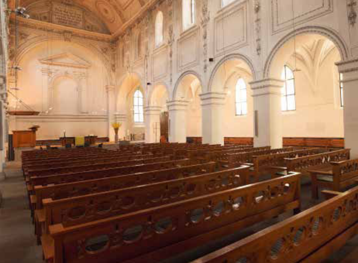
In der Predigerkirche wurde Mus verteilt

Im Mai forderte er die Frauen von Sant Vrenen auf, ihr Kloster zu verlassen.