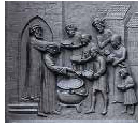
Mushafen (oben), Abendmahl (unten)

Vor den Kirchen und in den Strassen zu betteln, wurde strikt verboten. Bettler und Pilger, die um ein Almosen baten, bekamen, wenn sie vor Mittag kamen, eine Mahlzeit im alten Spital und mussten am Nachmittag weiterziehen. Man liess sie bestenfalls einmal übernachten, aber danach durften sie sich in Zürich ein halbes Jahr nicht mehr sehen lassen, schreibt Barbara Helbling.